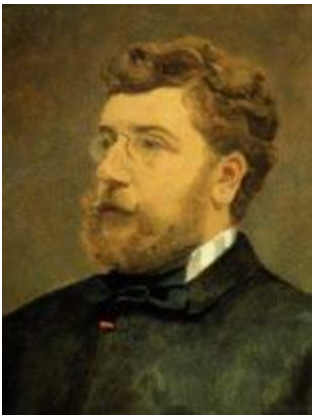
Bizet, Georges - Francia [1838-1875]

Nacido en París, el 25 de octubre de 1838. Creció en el seno de una familia de músicos. Su obra está impregnada de exotismo, una de las vertientes aventureras del espíritu romántico. Se formó desde niño en el Conservatorio. Estudió piano con Marmontel, órgano con Benoist y composición con Jacques Halévy. Recibió varios premios por sus obras, por lo que permaneció en Roma durante tres años. Al regresar se propone componer sólo óperas. A pesar de ésto, su estreno de "Los pescadores de perlas" no alcanza el éxito. Llevó una vida humilde como compositor casi desconocido. Tras el estreno de "La Arlesiana" obtuvo cierto renombre y éxito. Así, comenzaron a llegar algunos encargos como el de la Ópera Comique, para la cual compone su obra maestra, "Carmen". El fracaso -inexplicable para Bizet- de Carmen la noche de su estreno aceleró su muerte. Falleció a los 37 años en París, el 3 de junio de 1875.