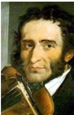
Paganini, Niccoló - Italia [1782-1840]